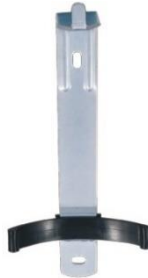
Εικόνα 1 : Βάση φορητού πυροσβεστήρα ξηράς σκόνης 6 Kg

δ) Θα φέρουν μεταλλικά μανόμετρα, εύκαμπτο ελαστικό σωλήνα, βάση στήριξης για τον τοίχο όπως αυτή που φαίνεται στην παρακάτω εικόνα 1.