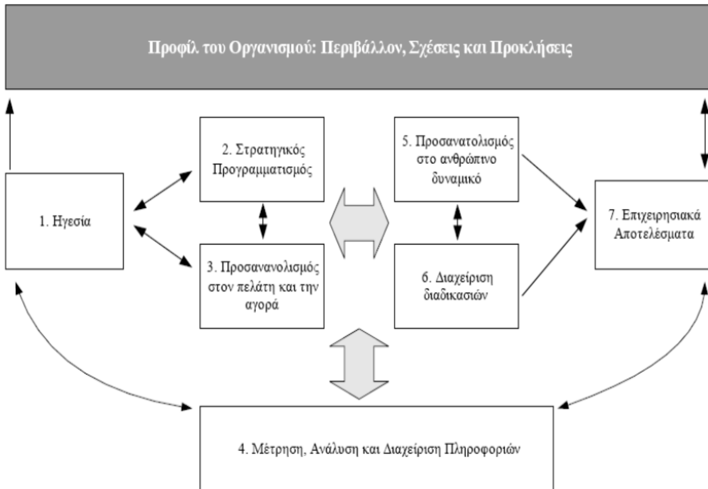
Σχήμα 3.1: Το μοντέλο του βραβείου ποιότητας Malcolm Baldrige (NIST, 2004)